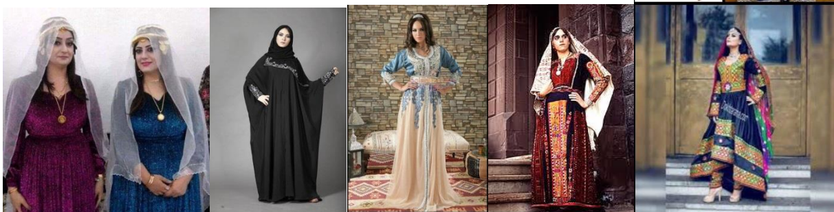
Syrien Ola - Kabba

Wir fliegen in die arabischen Länder und kochen mit den Frauen und essen traditionell auf Art und Weise des Orients. Wir beginnen unsere kulinarische Reise in Albanien und fliegen von dort aus weiter nach Afghanistan. Schließlich finden wir uns wieder im Irak um von dort nach Syrien zu gelangen und weiter geht es nach Palästina. Der Abschluss unseres Abenteuers bildet Marokko, wo wir bei Minztee die Köstlichkeiten verdauen und den Abend ausklingen lassen.